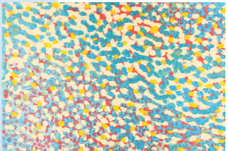
Hannah de Jong, Blauwgele wolk , aquarel op papier, 50 x 65 cm

We moeten vaker niets doen op het werk. Dat helpt prima om te ontspannen of creatief te worden. Lummelen: een heerlijk Nederlands woord. Gewoon uit het raam staren. Of naar een schilderij kijken waar je heerlijk in kunt verzanden.